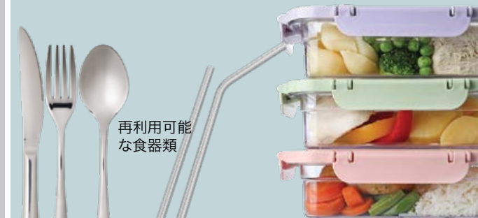
再利用可能な食器類