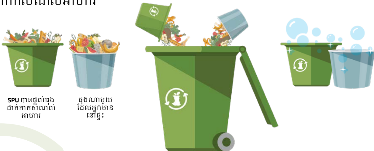
SPU បានផ្តល់ធុងដាក់កាកសំណល់អាហារ

3 លាងសម្អាតធុងដាក់កាកសំណល់អាហាររបស់អ្នក ហើយប្រើវាម្តងទៀត!