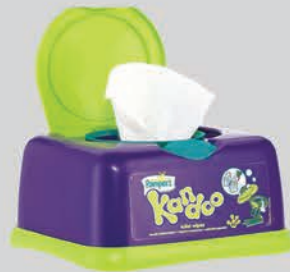
ផលិតផលអនាម័យ