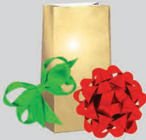
សំពត់បូ ឬ និង សម្ភារៈរុំខ្ទប់អំណោយ ដែលរលោង