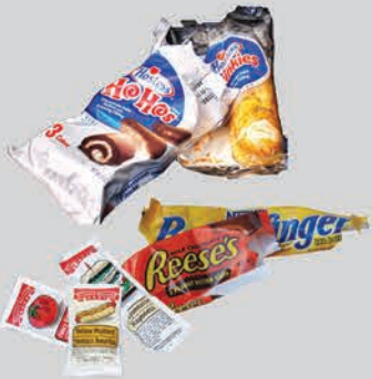
សម្ភារៈរុំខ្ទប់អាហារ