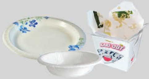
ចានប៉ាតក្រដាស (រលោង) ចានគោម និងប្រអប់សម្រាប់ ដាក់អាហារ ដែលប្រឡាក់អាហារ