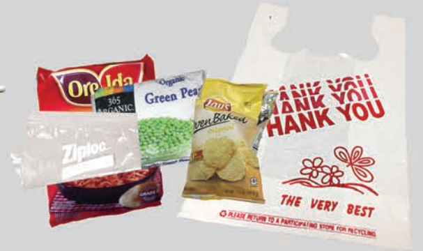
Ziploc®, ថង់ដាក់អាហារ និង ថង់សម្រាប់ដើរផ្សារ