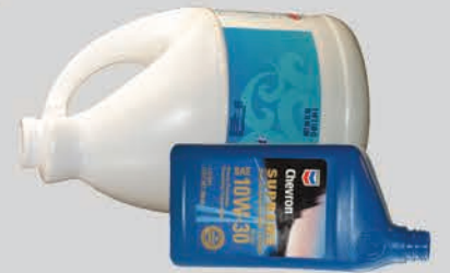
យកសំរាមតុល ចេញឱ្យអស់ពីផ្ទះ