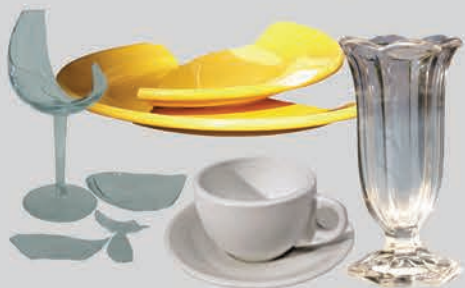
គ្រឿងសេរ៉ាមិច និងកែវ (ខូច ឬ មិនអាចប្រើបាន)