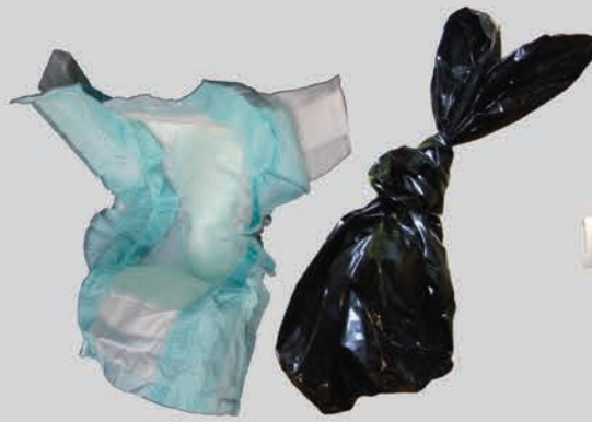
ខោទឹកនោម និងកាកសំណល់ ពីសត្វចិញ្ចឹមក្នុងផ្ទះ (ច្រកចង់)