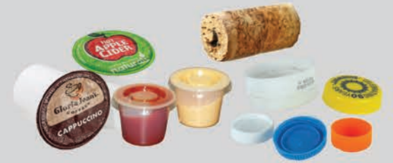
គម្របតូចៗ គម្របដប គ្រប និងតែង/កែវ (ក្រោមទំហំ 3 អ៊ីញ)