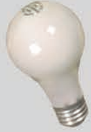
អំពូលប្រភេទគ្មាន ចំណាំងពន្លឺខ្លាំង