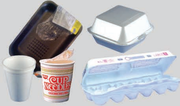
ប្រអប់ស្នោសម្រាប់ដាក់អាហារ