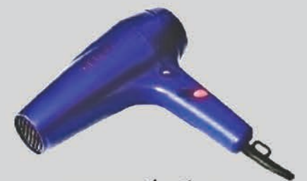
ឧបករណ៍ប្រើប្រាស់ ក្នុងផ្ទះ