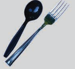
សម្ភារៈផ្ទះបាយ