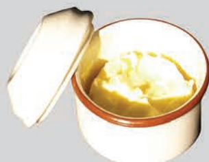
ខ្នាញ់ ប្រេងឆា និងប្រេងផ្ទះបាយ (ក្នុងធុងដែលមានសុវត្ថិភាពមួយ)