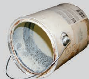
កំប៉ុងថ្នាំពណ៌ (បើកគម្រប, សម្អាត និង ចាក់ចោលឱ្យអស់)