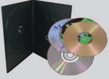
ស៊ីធី ធីវីធី និងប្រអប់វា

គ្មានអាហារ។ គ្មានសំណល់ផ្កាស្លៅ។ គ្មានរបស់អាចកែច្នៃឡើងវិញ។ គ្មានកាកសំណល់គ្រោះថ្នាក់។ ដាក់របស់ទាំងនេះនៅក្នុងរទេះសំរាមរបស់អ្នក។