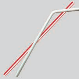
បំពង់បឺត