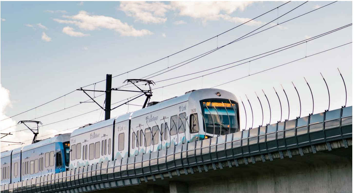
Tàu điện nhẹ sắp đến đường NE 130th St & I-5

*Lịch trình thi công có thể thay đổi. Lịch trình thi công phụ thuộc vào nhân công và vật liệu.