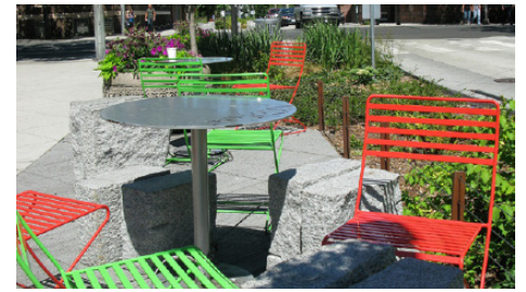
Fakkeenya baka ummataa Jiddu magaalaa Bell St irraa