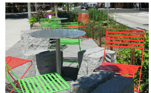
የህዝብ ቦታ ምሳሌ: Bell St, downtown