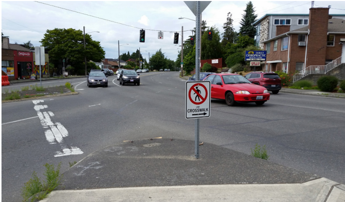
በ 15th Ave S እና S Columbian መንገድ መሀከ ካይ፣ በፈጣን ከሚላዩ መኪናዎች አጠብቅን የአግሪኛ “ደሴት” ቦታዎች።