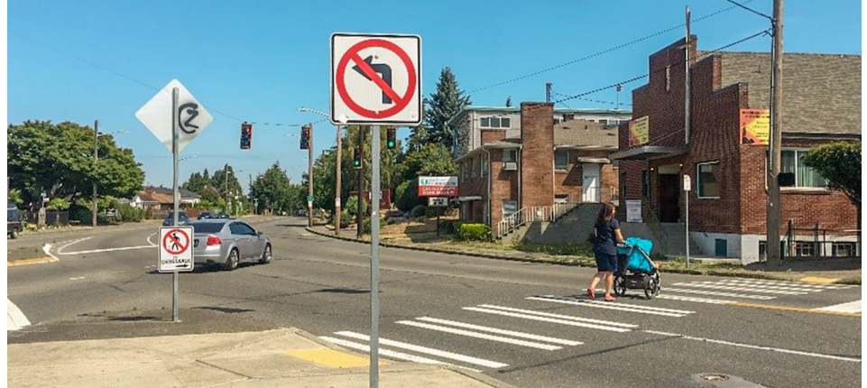
Foyyeffamawwan of eeggannoowal qunnamadandii 15ffaa S, S Columbian, fi S Oregon St.

Daandii 15ffaa S kan S Spokane St fi S Angeline St gidduu namoota Beacon Hill keessa fi naannoo ishee imalaniif qunnamtii barbabachisaa ni dhiyeessa. SDOT (Seattle Department of Transportation) iddoo kana keessatti foyyeffamawwan wanoota fayyadamtota hundumaaf barbaachisu madaalan gochaa kan jiran yoo ta'ukuni namoonni hundi bakka deeman of eeggannoo haala abdachiisaa ta'ee akka argataniifidha.