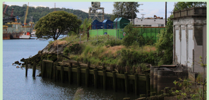
Georgetown - Wanaaji gelida 8th Ave. S iyo Gateway Park North si loogu xidho dadka degan webiga Duwamish.