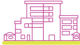
Sentro ng Komunidad