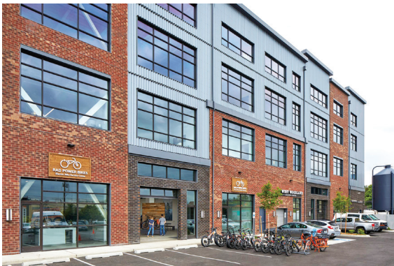
West Woodland Business Center, Ballard, WA.

Nagbibigay din ang mga kapitbahayan sa lunsod ng mga pagkakataon para sa mga negosyong nasa bahay, mga tindahan sa sulok, at maliliit na institusyon upang payagan ang mas maraming tao na maglakad, magbisikleta, at gumulong sa pang-araw-araw na pangangailangan.