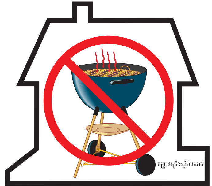
ចង្ក្រានប្រើឧស្ម័នកាត់សាច់