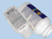
Mga bote ng tabletas (walang mga bote ng preskripsiyong gamot)