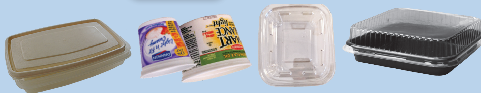
Malinis na plastik at mga coated na papel na lagayan ng pagkain