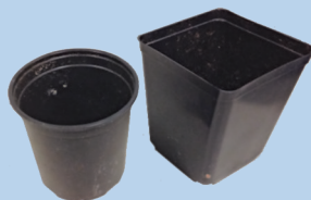
Mga plastik na paso