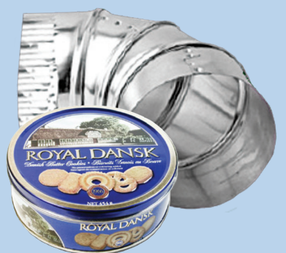
Scrap na bakal (mas maliit sa 2 ft. x 2 ft. x 2 ft.)