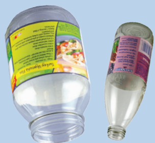
Mga bote at garapon