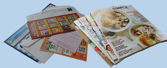
Mga sulat, magazine at iba't ibang papel