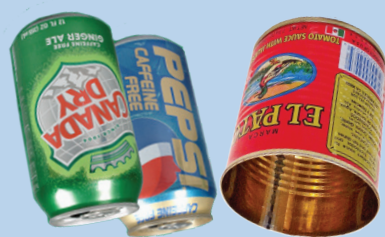
Mga latang aluminum at bakal