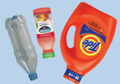
Mga plastik na bote (lahat ng kulay)