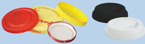
Mga Takip (3 pulgada o mas malapad)