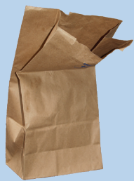
Mga papel na supot