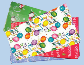
Pambalot na papel