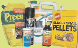
Các Sản Phẩm Dành Cho Cỏ Và Vườn Tự Nhiên