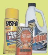
Các Chất Làm Vệ Sinh Trong Gia Đình

XIN GỌI ĐƯỜNG DÂY ĐIỆN THOẠI VỀ NHỮNG SẢN PHẨM GIA DỤNG ĐỘC HẠI TẠI SỐ 206-296-4692 ĐỂ LỰA CHỌN CÁCH PHÉ THẢI