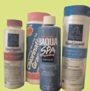
Các Tiếp Liệu Dành Cho Hồ Bơi và Khoáng Suối (Spa)