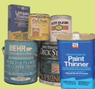
Sơn Dầu, Chất Pha Sơn và Chất Nhuộm Màu Không Phải Nhựa Mủ