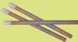
Pháo Chiếu Sáng Dùng Cho Đường Sắt

GỌI ĐIỆN THOẠI SỐ 1-800-RECYCLE HOẶC MỞ TRANG ĐIỆN TOÁN www.TakeItBackNetwork.org