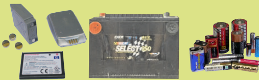
Điện Trì: Xe Hơi và Đồ Gia Dụng