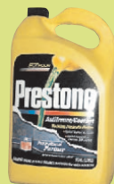
Chất Chống Đông Đá

GỌI ĐIỆN THOẠI CHO QUẬN HẠT KING VỀ RÁC KHÔNG THUỘC DẠNG LỎNG (SOLID) TẠI SỐ 1-800-325-6165, SỐ MÁY PHỤ 6-4466