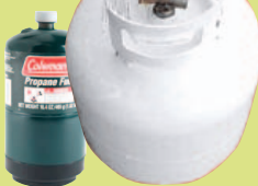
Hơi Đốt Propane, Butane