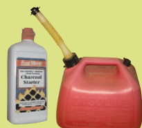
Các Chất Lỏng Dễ Cháy Giới Hạn: tối đa 30 gallons xăng

GỌI ĐIỆN THOẠI CHO CƠ QUAN DUY TRÌ KHÔNG KHÍ TRONG LÀNH PUGET SOUND TẠI SỐ 206-343-8800