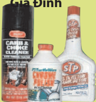
Các Sản Phẩm Dùng Cho Xe Hơi

(Lon sơn rỗng mở nắp có thể bỏ vào thùng rác ĐƯỢC)