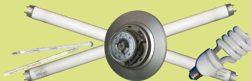
Thủy Ngân – Bao gồm Nhiệt Kế, Dụng Cụ Điều chỉnh Nhiệt (Thermostats), Đèn Ống và Bóng Đèn Huỳnh Quang (tối đa 10 đèn ống và bóng đèn)