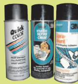
Các Vật Dụng Dành Cho Sở Thích Riêng