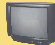
Máy Truyền Hình và Màn Ảnh Máy Điện Toán, Đồ Điện Tử

Muốn biết thêm tin tức, hãy gọi Đường Dây Điện Thoại Về Những Sản Phẩm Gia Dụng Độc Hại, Thứ Hai đến Thứ Sáu, từ 9 giờ sáng đến 4 giờ 30 chiều, ngoại trừ ngày lễ, Tại số điện thoại 206-296-4692 hoặc 1-888-TOXIC ED (869-4233).