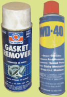
ናይ መቕዕንን፣ መሕቀቕን ቀመማት