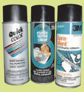
ንመዘናግዒ ኢልኩም ትጥቀምሉ ቀመማት