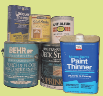
ብዘይቲ ዝተሰርሐ መለቕለቕ ገዛን ናይ መለቕለቕ መቕዕንን