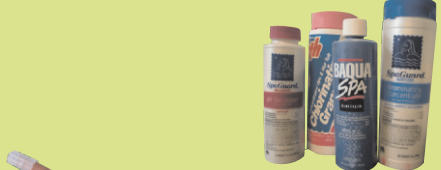
ናይ መሕንበሲ ማይ ቀመማት