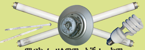
ሜርኩሪ ዘለዎም አቕሑ ከም ተርፎመተር፣ ተርፎስታት፣ ፍሎረሰንት መብራህቲ