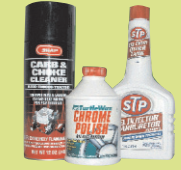
ንመዘና መተዳራረዪ ትጥቀምሉ ቀመማት