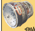
ፕሮሑ ናይ ቦያ ታኒካታት (ብዘይመክድኒ አብ ጉሓፍ ክተኣትውዎ ትክእሉ ኣይኮኑን።)

ብዛዕባ ለይተክስ ፕሮፕሎን 206-296-4692 ደዊልኩም ተወከሱ።