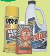
ናይ ገዛ መጽራረዪ ቀመማት

አይኣል ነዞም ዝስዕቡ ነገራት አብ ናይ ሓደገኛ ጉሓፍ ክትወስድዎም ብቑዓት አይኮኑን። ናይ ገዛ ሓደገኛ ጉሓፍ ደዊልኩም አማራጺ ክትረኽቡ ተወከሱ።