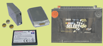
ባተሪ፣ መዘና፣ ሊትየም