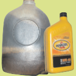
ናይ መዘና ዘይቲ