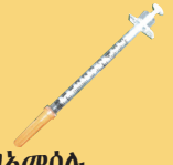
ናይ ሕክምና በላሕቲ ነገራት ከም መርፍእ ዝእመሰሉ