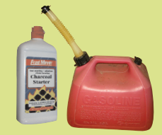
ኩሉ ዝነድድ ፈሳሲ