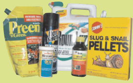
ናይ ሳዕርን ዕንባባታትን ትጥቀምሉ ቀመማት