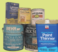
Масляные краски, разбавители и красители Латексные краски не принимаются