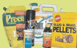
Товары для газона и сада