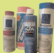
Принадлежности для бассейна и джакузи