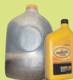
Отработанное и новое моторное масло