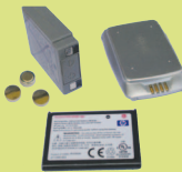
Батареи: домашние и автомобильные аккумуляторы Лимит: 5 аккумуляторов