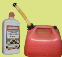
Воспламеняющиеся жидкости Лимит: не более 30 галлонов бензина