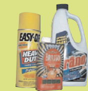
Хозяйственные чистящие средства