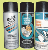
Принадлежности для хобби