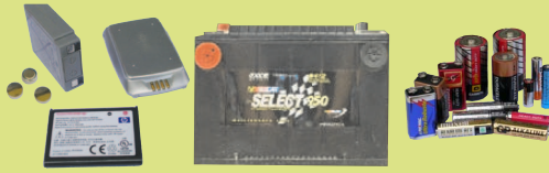
電池：家用和車用 限制：5 個車用電池