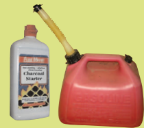
易燃液體 限制：至多 30 加 侖汽油