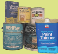
油基塗料、 稀釋劑和顏料 無乳膠