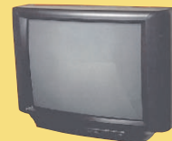
電視和電腦顯示 器、電子產品

撥打 1-800-RECYCLE 或者造訪 WWW.TAKEITBACKNETWORK.ORG