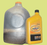
使用過和未使 用過的機油