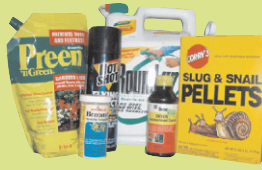
សារធាតុនៃផលិតផលដាក់ស្មៅ និងសួនច្បារ