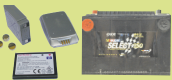
ថ្នាំល/ធុងអាកុយ : ថ្នាំអាចបញ្ចូលភ្លើងភ្លើងវិញបាន, ធុងអាកុយថយន្ត, ថ្នាំមានល្បាយលីស៊ីយ៉ូម