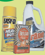
សារធាតុលាងសម្អាត ផ្ទះសម្បែង