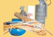
គ្រឿងផ្ទុះ