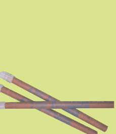
ឧបករណ៍សម្រាប់ដុតបញ្ចុះឱ្យសញ្ញាតាមផ្លូវថ្នល