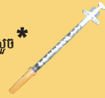
វត្ថុវេជ្ជសាស្ត្រមុតស្រួច* (មូលចាក់ថ្នាំ)