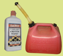
សារធាតុរាវដែលអាចទាក់ទាញចំហាបភ្លើង