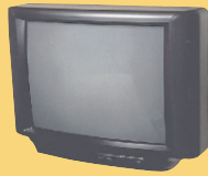
ម៉ូតូទំនើបស្បែកនិងកុំព្យូទ័រ (ចូរមើលទំព័រខាងខ្នងដើម្បីរកមើល Take it Back Network : បណ្តាញទទួលយកវ៉ាញ)