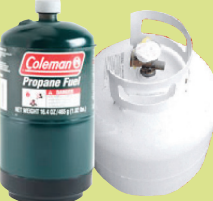
ឧស្ម័នប្រូផែន, ឧស្ម័នប៊ូបេន