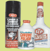
ផលិតផលថយន្ត