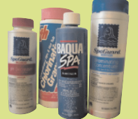
ឧបករណ៍ចំពាក់អាងវែលទឹក និងអាងងូតទឹកក្តៅ