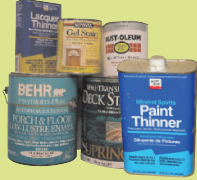
ថ្នាំលាបផ្ទះ, ថ្នាំលាបឱ្យរលោង, និងថ្នាំលាបបង្ការជម្រាបទឹកដែលមានល្បាយប្រេង,