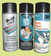
វត្ថុលេងកម្សាន្ត