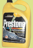
ទឹកតែនៃប្រព័ន្ធសម្រាប់ធុងទឹកឡាយ