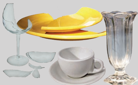
เซรามิกและเครื่องแก้ว (แตกหักหรือไม่สามารถใช้งานได้)