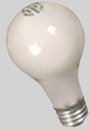
หลอดไฟประเภทไม่เรืองแสง