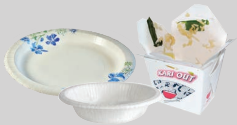
จานกระดาษ ถ้วยและภาชนะสำหรับการซื้ออาหารกลับไปกินที่บ้าน แบบเคลือบผิว (มันวาว) ที่เลอะคราบอาหาร