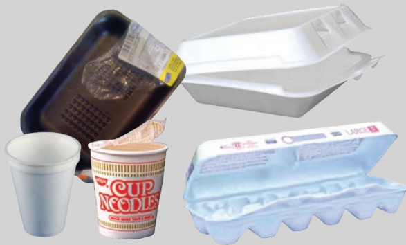
ภาชนะโฟม