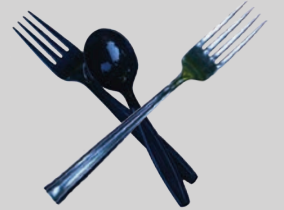
เครื่องใช้ในครัว