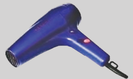
เครื่องใช้ไฟฟ้าขนาดเล็กในครัวเรือน