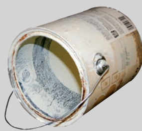
กระป๋องสี (ไม่ปิดฝา แห้งและใช้หมดแล้ว)