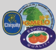
สติ๊กเกอร์ที่ติดบนผลไม้