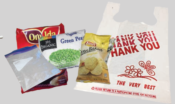
Ziploc® ถุงพลาสติกบรรจุอาหารแบบใช้ครั้งเดียว