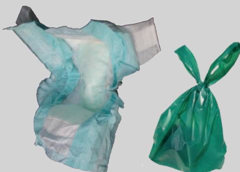
ผ้าอ้อมเด็กและสิ่งปลูกจากสัตว์เลี้ยง (ถุง)