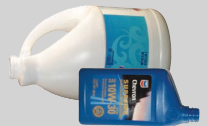
สารพิษที่หมดแล้ว ภาชนะบรรจุ