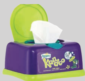
ผลิตภัณฑ์เพื่อสุขอนามัย