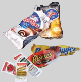
วัสดุห่ออาหาร