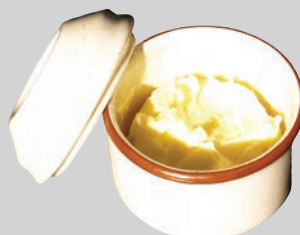
Кулинарные жиры и масла (в надежном контейнере)