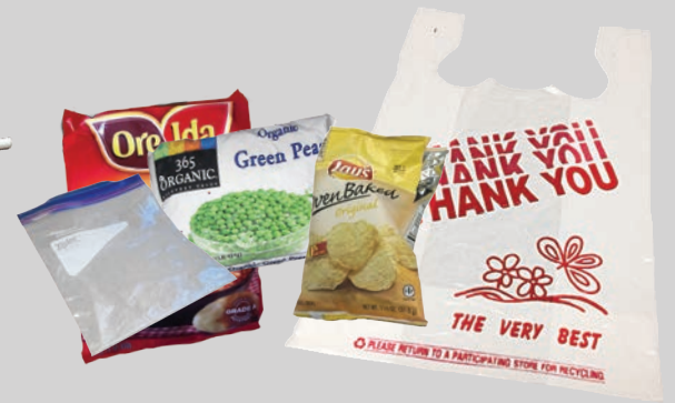
Пакеты с замком Ziploc®, пакеты от продуктов питания и отдельные пластиковые пакеты