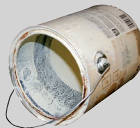
Банки от краски (без крышек, сухие и пустые)