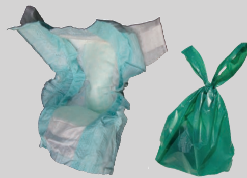
Подгузники и отходы жизнедеятельности животных (в пакетах)