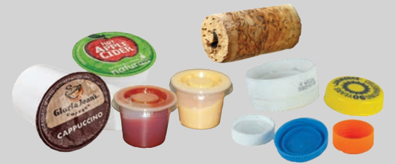
Маленькие крышки, колпачки и стаканчики (меньше 3 дюймов в диаметре)