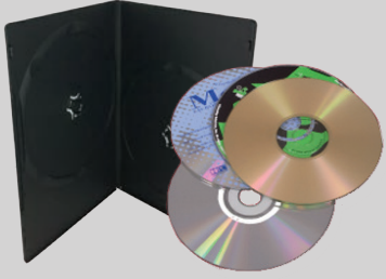
CD-, DVD-диски и футляры

Кладите следующие предметы в бак для мусора.