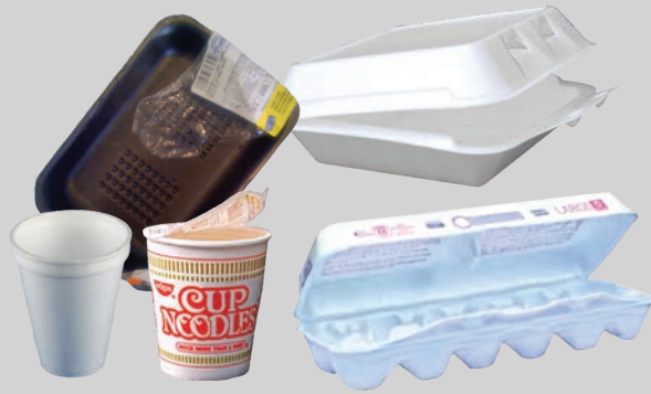
Контейнеры из пенопласта