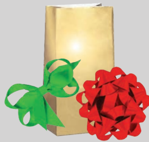
Ленты, банты и металлизированная подарочная обертка