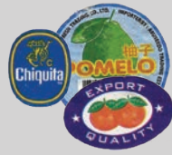
Наклейки с фруктов