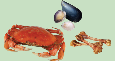
Gogaa fi lafee