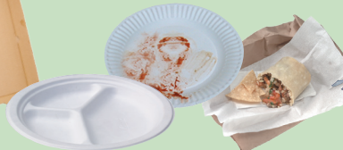
Waraqaalee xuraawoo nyaanni keessaa dhume kan hin uwwifamne