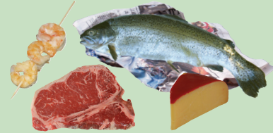
Foon,qurxummii fi bu'aalee loonii