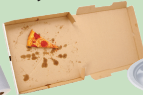
Qodaawwan piizzaa xuraawoo