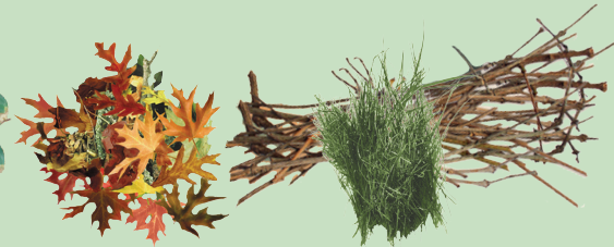
Baala,dameewwanii fi marga

Laastikiin hin eeyyamamu . Guffaan laastikii hin eeyyamamu . Sibilli hin eeyyamamu . Qaruuraan hin eeyyamamu . Kosiin horii hin eeyyamamu .