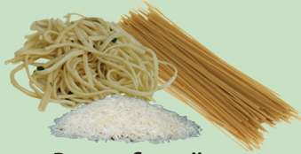
Paastaa fi ruuzii