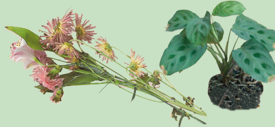
Daraarrawwanii fi biqqiltoota mana