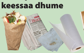
Guffaalee waraqaa,fooxaawwan & Maarraba