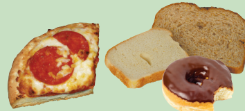
Daabboo fi lja midhaanii