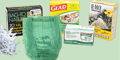
Guffaalee burkutaa'uu danda'an