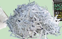
Waraqaa ciccitaa (Kosii mooraa waliin wal make)