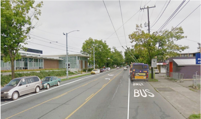
បន្ទាប់ពីការសាងសង់ (រដូវស្លឹកឈើជ្រុះឆ្នាំ ២០១៨)

យើងក៏បានពិចារណាអំពីការកែប្រែមួយចំនួននៅត្រង់ផ្លូវប្រសព្វនៃផ្លូវ S Henderson St ។ ដោយស្ថាប័នភាពស្មុគស្មាញនៃខ្សែភ្លើងពីលើរបួសយន្តក្រុង នៅត្រង់ទីតាំងនេះ យើងនឹងចំណាយពេល ១ ឆ្នាំកន្លះបន្ថែមទៀត ដើម្បីរៀបចំផែនការកែលម្អ និងស្វែងរកប្រាក់សម្រាប់ការអនុវត្តគម្រោង ដើម្បីឲ្យផែនការកែលម្អនេះអាចត្រូវបានចាប់ផ្តើមស្របពេលនិងការចាប់ផ្តើមនៃគម្រោងកែលម្អ RapidRide Rainier ។