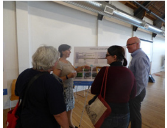
在項目開放日收集公眾意見