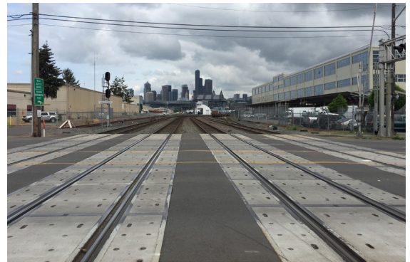
在S Lander St的鐵路道口