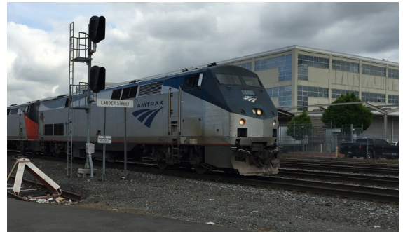
美鐵火車經過S Lander St