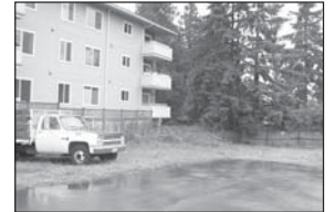
Sau khiếu nại

Những khiếu nại ẩn danh có thể thực hiện bằng điện thoại.