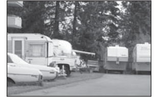
Trước khiếu nại