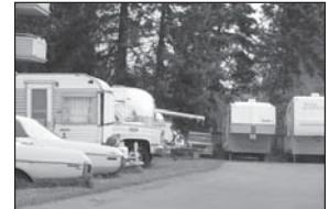
Antes de presentar la queja