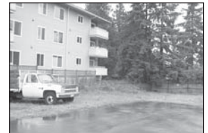
Después de presentar la queja

Puede presentar su queja anónimamente por teléfono.