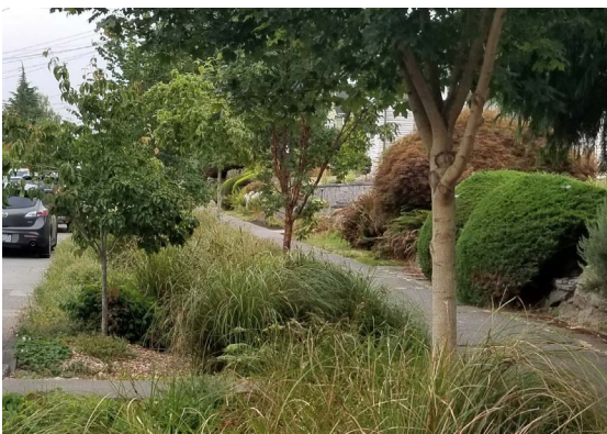
在住宅街道上已完工的自然排水系統示例。