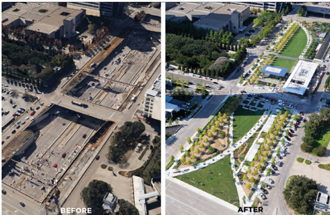
Klyde Warren Park - Dallas, TX

本地的“蓋子”包括華盛頓州會議中心和高速路公園、西雅圖市政大樓、以及位於默瑟島的奧布里戴維斯公園。