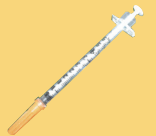
ሹል የሆኑ የሕክምና ዕቃዎች* (መርፈዎች)