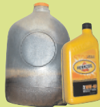
ጥቅም ላይ የዋለ ደልዋስ የሞተር ዘይት