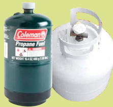
ፕሮፕሪ : ቢው-ቴይን