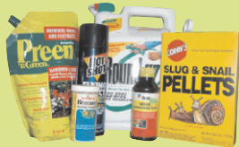
የሱን ኬንድ ጋርደን ውጤቶች