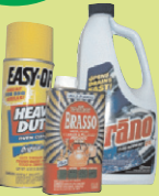
የቤት-ውስጥ ማጽጃያ ኬሚካሎች