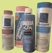
የውሃ ገንጻፍ የስፓ ቁሳቁሶች