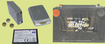
ባትሪዎች : የሚሞላ (ፊቻርጅ-ባል)፣ የሙከራ : ሊቲየም