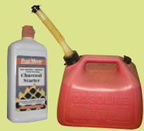
በቀላሉ በላት የሚቃጠሉ ፈሳሾች