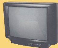
ቴሌቪዥኖች እና የኮምፒዩተር ሞላተሮች (ስለ "ቴክኒካል ዩቲሊቲ" ለማወቅ ከጀርባ ይመልከቱ)