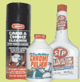
ለሙከራ ጥገና የሚያገለግሉ ውጤቶች