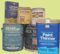
ዘይት-ያለባቸው ቀለሞች : የቀለም ማቅጠያዎች እና ቀለም የነካቸውን ዕቃዎች