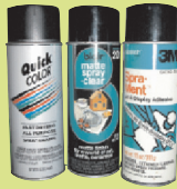
አኔጅ ሥራ ያገለገሉ ቁሳቁሶች