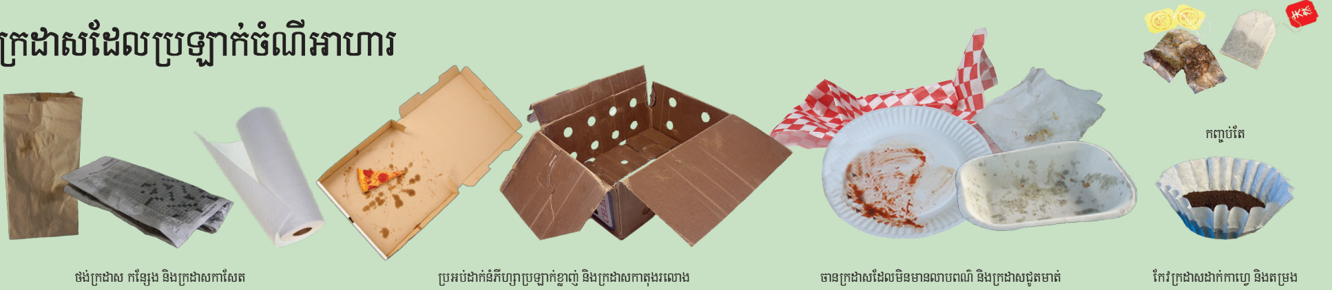
ធុងក្រដាស កន្សែង និងក្រដាសកាសែត