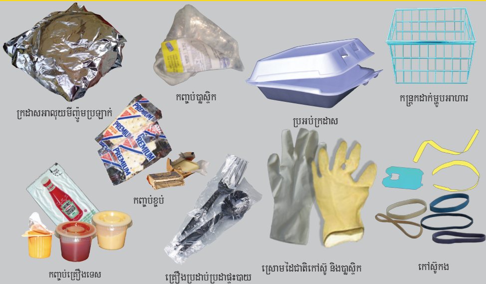
ក្រដាសអាសយដ្ឋានប្រឡាក់

ដាក់សម្ភារៈទាំងនេះក្នុងធុងសំរាមរបស់អ្នក។