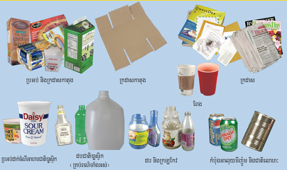
ប្រអប់ និងក្រដាសកាតុង

ដាក់សម្ភារៈទាំងនេះក្នុងធុងសម្រាប់កែច្នៃប្រើប្រាស់ឡើងវិញ។