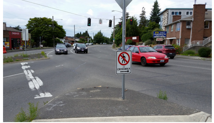
Một “đảo” nhỏ dành cho người đi bộ nằm ở giữa ngã tư của Đại lộ 15th Ave và S Columbian Way, gần các phương tiện xe chạy nhanh.