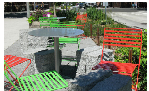
Ví dụ về không gian công cộng ở Bell St, trung tâm thành phố