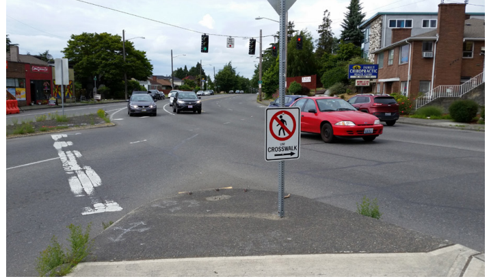
Una pequeña "isla" peatonal se ubica en medio de 15th Ave S y S Columbian Way, cerca de vehículos de rápido movimiento.