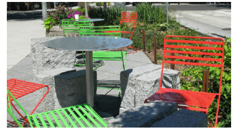
Ejemplo de espacio público en Bell St, centro