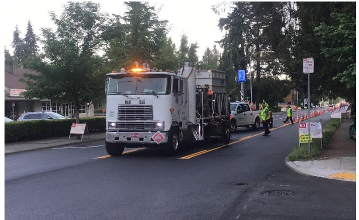
Example of crews striping the street