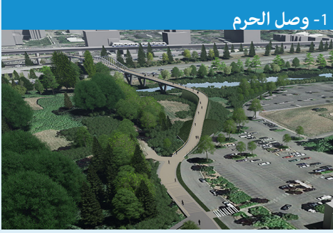
1- وصل الحرم

وصل مباشر بمستوى يسمح بخط نظر أفضل عبر الجسر