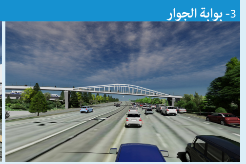
3- بوابة الجوار

الخطوط الانسيابية للجسر حيث يعبر فوق طرق السفر-5 المتجه للجنوب يخلق نقطة لا تنسى للعبور بين مجتمعين