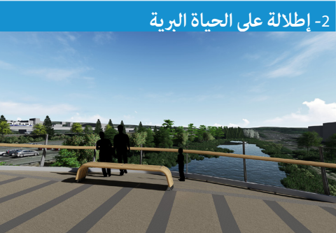
2- إطلالة على الحياة البرية

تقدم الإطلالة على الحياة البرية لمستخدمي الجسر بقعة راحة ومنظراً للبركة والأرض الرطبة