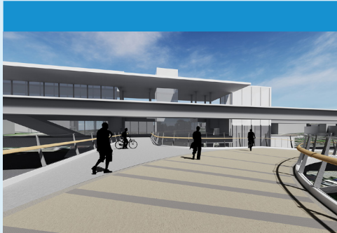
4- إطلالة على 100TH ST NE ومحطة نورثغيت

تقدم الإطلالة على الحياة البرية لمستخدمي الجسر بقعة راحة ومنظراً للبركة والأرض الرطبة