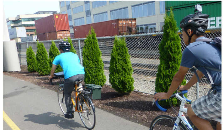
Nhóm dự án đang khảo sát hiện trạng đường mòn bằng xe đạp đặc biệt

Các đường mòn đa dụng là một phần quan trọng của mạng lưới giao thông thành phố. Chúng thuận tiện khi tiếp cận các vùng lân cận, các công viên, trường học, các khu mua sắm và các trung tâm việc làm dành cho mọi lứa tuổi và khả năng. Đó là lý do tại sao cần xây dựng các tuyến đường mòn của chúng ta một cách tốt nhất.