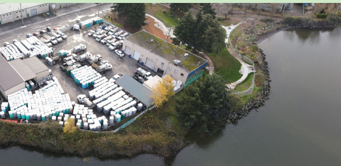
តំបន់ South Park - បញ្ចប់ដំណើរការរៀបចំកន្លែងផ្ទុកដំឡើងដល់កំណត់អាទិភាពសហគមន៍សម្រាប់ទីតាំងអគ្គីសនី Unity Electric Site ។