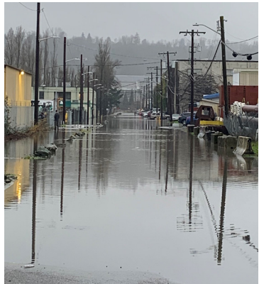
ពីឆ្នាំទៅស្មើនេះ ១) អនុករណ៍សម្របចិត្តដំបូងដើម្បីតាមដងស្ទើរតែស្របគ្នា Duwamish ។ រូបថតផ្តល់ដោយលោក Paul J. Brown; 2) ទីកន្លែងនៃតំបន់ខុសសហគមន៍ South Park ។ រូបថតផ្តល់ដោយ Seattle Public Utilities; 3) អនុករណ៍សម្របចិត្ត សម្របចិត្តស្ទើរតែស្របគ្នា Duwamish ។ រូបថតផ្តល់ដោយលោក Tom Reese ។