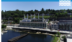
Lander St Bridge